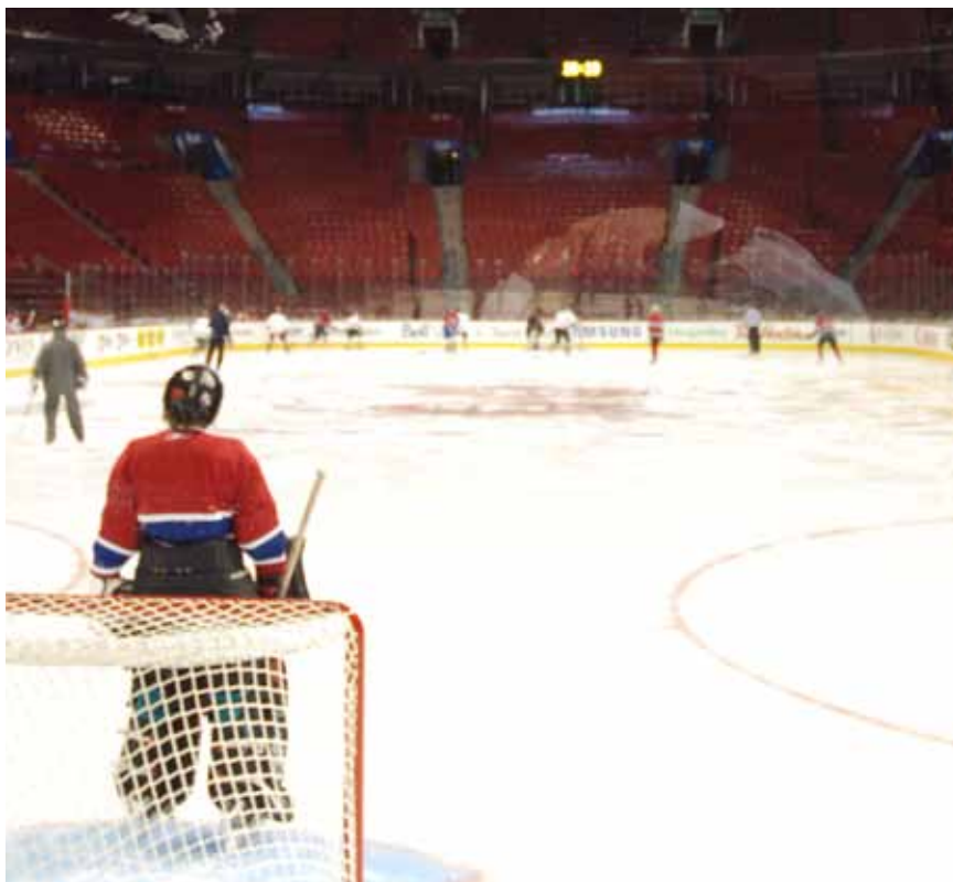
Jeunes du CJM-IU sur la glace du Centre Bell. Janvier 2011

Par ailleurs, les jeunes en réadaptation ont pratiqué leurs activités sportives habituelles tandis que 139 enfants et adolescents en foyers d'accueil ont pu participer à des camps de vacances.